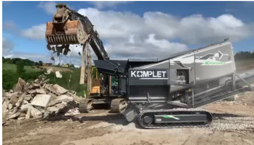
Slika 10. drobilica drvenog otpada koju je moguće koristiti i za građevinski otpad

Drvenasti otpad od namještaja i građevinske stolarije trenutno predstavlja jednu od najvrijednijih frakcija otpada na hrvatskom tržištu (vrijednija od plastike, stakla, biotpada itd.)