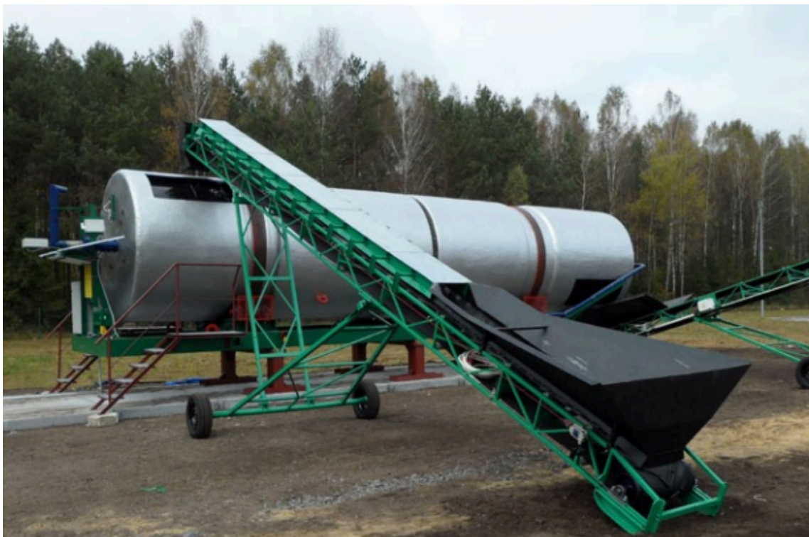
Slika 9. mehaničko izdvajanje organske frakcije iz MKO

Biološka obrada otpada postupkom biostabilizacije prije konačnog odlaganja je moguće rješenje za smanjenje količina otpada koji se odlaže u ljetnim mjesecima na odlagalištu Treskavac umjesto ranijeg planiranja obrade i odlaganja otpada u centru za gospodarenje otpadom Marišćina. Ukoliko bi predobrada MKO mogla omogućiti homogenu mokru frakciju, moguće je taj preostatak podvrgnuti postupku biostabilizacije putem uređaja koji mogu postupkom dinamičke obrade smanjiti količine i biorazgradivu komponentu otpada za svega 3 dana. Tijekom tog razdoblja, otpad je podvrgnut kontinuiranom kretanju u rotirajućem bubnju uz slobodni dotok zraka. Proces se kontrolira elektronski, uz mjerenje i bilježenje temperaturnih vrijednosti koje prevladavaju, kao i sadržaja procesnih plinova. U slučaju nastanka poremećaja u stabilnosti procesa, uključuje se ventilator koji dovodi dodatnu količinu zraka. Cijeli proces odvija se pri temperaturi od 45 do 65°C, što osigurava potpunu inaktivaciju patogenih agenata sadržanih u otpadu. Rezultati rada uređaja predstavljaju smanjenje za čak 50% ulazne mase. 4