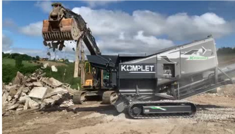
Slika 10. drobilica drvenog otpada koju je moguće koristiti i za građevinski otpad

Drvenasti otpad od namještaja i građevinske stolarije trenutno predstavlja jednu od najvrijednijih frakcija otpada na hrvatskom tržištu (vrijednija od plastike, stakla, biotpada itd.)