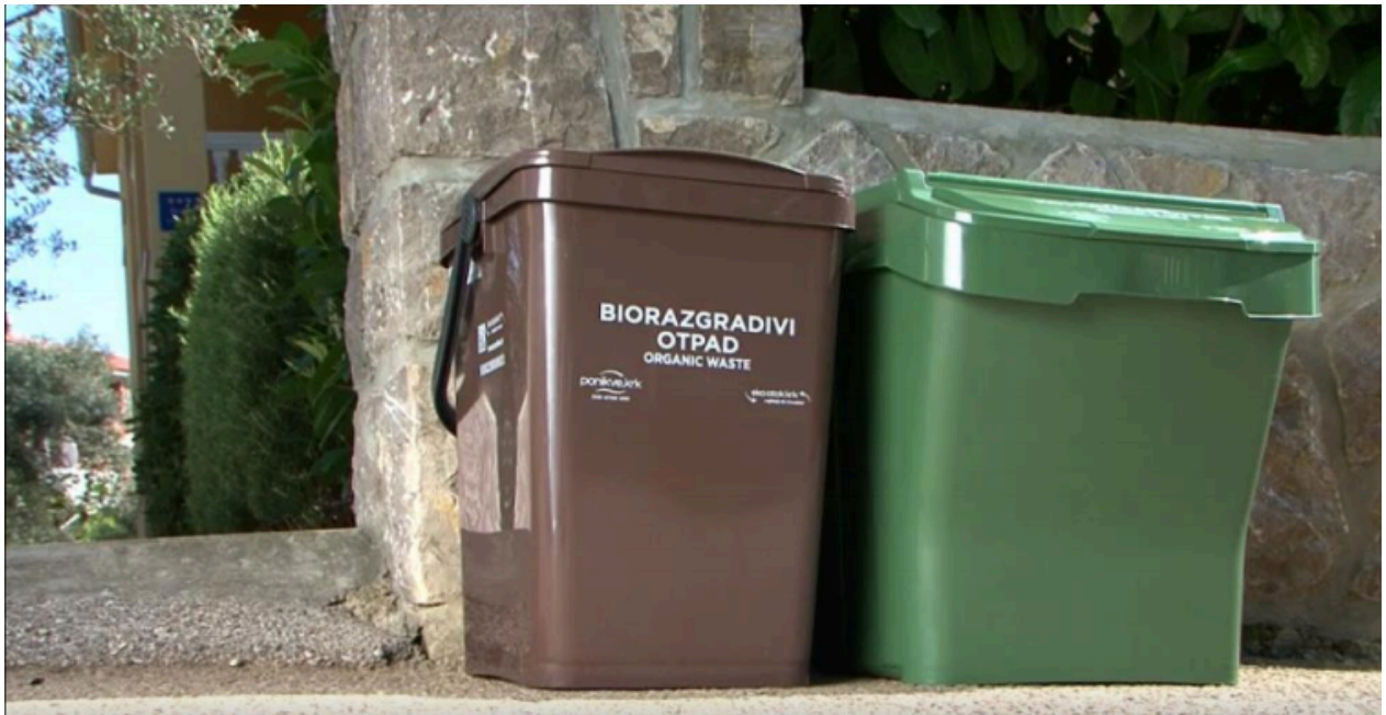
slika 2. Spremnici za prikupljanje MKO i biorazgradivog otpada

Iako je prvotno planirano da se domaćinstvima podjele samo kante za miješani komunalni otpad zapremine 35 l i kante za biootpad zapremine 23 l, a tek naknadno kante za plastiku, papir i staklo, na terenu se je pokazalo da je potrebno istovremeno djeliti kante za sve vrste otpada. Stoga je napravljen plan te su podjelom obuhvaćena ponajprije priobalna mjesta a kasnije ona u unutrašnjosti otoka. Dovršetak podjele planira se do kraja 2023. godine. Za veće stambene zgrade (6 i više stanova) nisu podijeljene manje kante već zajedničke veće kante zapremine 120 – 360 l.